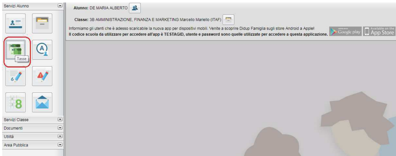
(accesso ai servizi di pagamento)

Il servizio di pagamento delle tasse e dei contributi scolastici è integrato all'interno di Scuolanext - Famiglia, ed è richiamabile tramite il menù dei Servizi dell'Alunno .